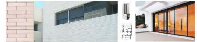
Fachada y carpintería exterior

De dos hojas. Hoja exterior de ladrillo cerámico caravista o revestido con mortero de revoco color claro según diseño, enfoscado hidrófugo en su cara interior; Cámara de Aire: Aislamiento de lana de Roca; Hoja interior de tabiquería en seco. Alcanzando el bienestar térmico y asegurando una envolvente térmica que limite la demanda energética de la vivienda.