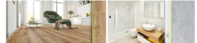
Pavimentos y revestimientos

Ventanales y balconeras de aluminio lacado con rotura de puente térmico y acristalamiento doble con cámara tipo Climalit 4/12/3+3 o superior. Correderas o batientes según dimensiones y estancias; Persianas; Barandillas de acero.